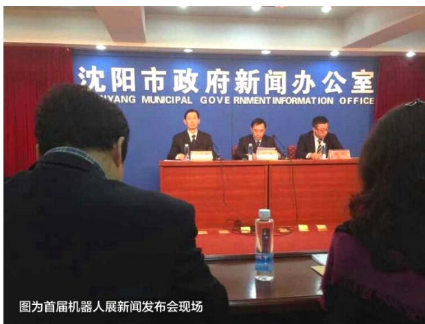
图为首届机器人展新闻发布会现场